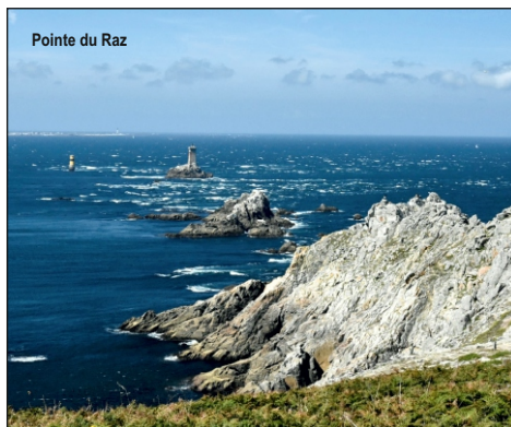
Pointe du Raz

4. den: Přesun na tzv. POBŘEŽÍ RŮŽOVÉ ŽULY patřící mezi nejkrásnější přírodní scenérie Bretaně, kde obí kamenné bloky omývá smaragdově zbarvené moře. Odpočinek v populárním letovisku PLOUMANACH , původně rybářském městečku s pěknými písčnými plážemi. Ve vesničce GUIMILIAU prohlídka kamenného kostelíka obklopeného unikátní kalvárií s více než 200 postavami zobrazujícími Kristovu utrpení. Návštěva romantické vesničky LOCRONAN s pitoreskními domky, které posloužily jako kulisa mnohých slavných filmů francouzské kinematografie. Ubytování na okraji Quimperu.