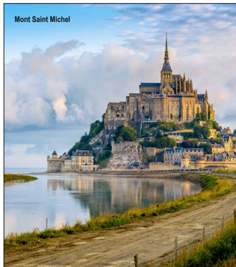
Mont Saint Michel

3. den: Návštěva jedné z nejnavštěvovanějších památek Francie - proslulého klášterního komplexu MONT SAINT MICHEL zbudovaného na žulovém ostrůvku uprostřed mořských písčín. Prohlídka mohutnými hradbami obehnaného SANT MALO , přístavního města proslaveného korzárů. Zastávka na mysu CAP FRÉHEL s úchvatnými pískovcovými útesy bičoványými vlnami Atlantiku. Nenáročná vycházka Smaragdovým pobřežím od majáku k majestátní pevnosti FORT LA LATTE . Ubytování u Saint Brieu.